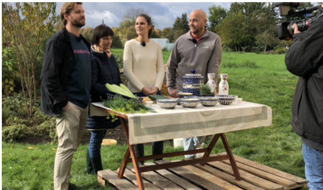
Das spanische Fernseheteam dreht bei Firma Spreewald Müller

Über den Stand der Umsetzung des Programmes LEADER mit diversen Projektvorstellungen wurde ebenfalls kontinuierlich informiert. Recherche- und Bildanfragen verschiedener Verlagsredaktionen und Pressedienste wurden stets umgehend beantwortet. Verstärkt erreichten das Regionalbüro Anfragen zur Kontaktvermittlung an Kahnakteur*innen. Auch Mitglieder des Vereins/ des Vereinsvorstandes waren zu verschiedensten Anlässen und Themen gefragte Interview-Partner*innen von Journalist*innen. Im Oktober 2025 organisierte der Spreewaldverein e.V. die Drehorte zu den Themen Gurke und Meerrettich für das spanische Fernsehen.