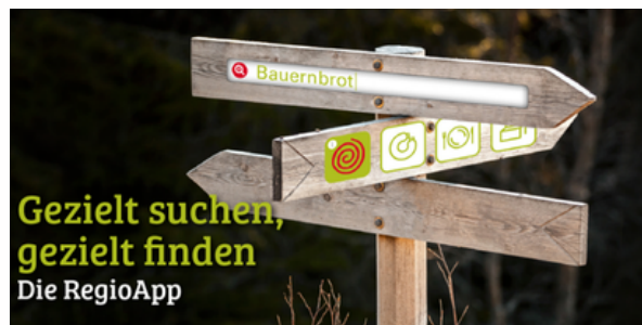
Screenshot Startseite Regioapp

Der Bundesverband Regionalbewegung e.V. stellt die App seit 2013 zur Vermarktung regionaler Lebensmittel und Gastronomie Verfügung. Für die registrierten Betriebe unter der Dachmarke entstehen bei der Nutzung keine zusätzlichen Kosten, da wir Mitglied im Bundesverband sind.