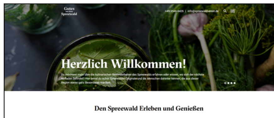
Screenshot Startseite www.gutes-spreewald.de

Auch am Internetportal www.gutes-spreewald.de wird im Jahresverlauf kontinuierlich weitergearbeitet. Vorstellungen neu gewonnener zertifizierter Anbieter*innen der Dachmarke Spreewald im Wirtschaftsraum Spreewald wurden auch in 2024 fortlaufend ergänzt und bestehende Präsenzen aktualisiert und vervollständigt. Die Klassiker, Spreewälder Gurke g.g.A., Spreewälder Meerrettich g.g.A., Spreewälder Leinöl g.g.A. und Spreewälder Gurkensülze g.g.A. werden vorgestellt und auf Zusammenhänge innerhalb regionaler Wertschöpfungsketten hingewiesen. Darüber hinaus wird allgemeingültig über das Qualitätsmanagementsystem informiert, welches hinter der regionalen Dachmarke Spreewald als Gütesiegel steht.