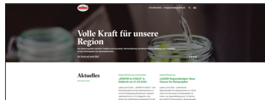
Screenshot Startseite www.spreewaldverein.de