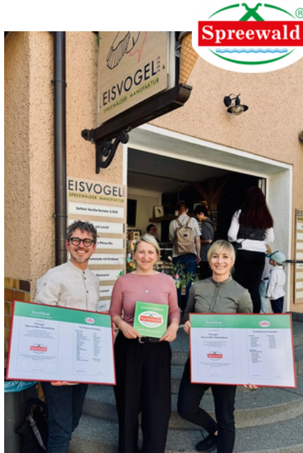
Übergabe der Zertifikate an den Eisvogel in Burg im Mai 2025. Sowohl die Eismanufaktur als auch das Café wuden mit der Dachmarke ausgezeichnet.

Der Spreewaldverein ist Zeichengeber der regionalen Dachmarke Spreewald.